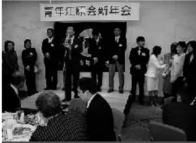
青年江原会新年会を1月18日(土曜日) 鶴屋ホールにて開催

例年、忘年会といふことで恒例となつておりましたが、江原会行事等との関係で、新年会に変更し開催したにもかかわらず、また、長引く厳しい経済情勢の中で、約一〇名とい