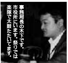
市役所本下です。祭りでは 案外で太鼓打たれてます。