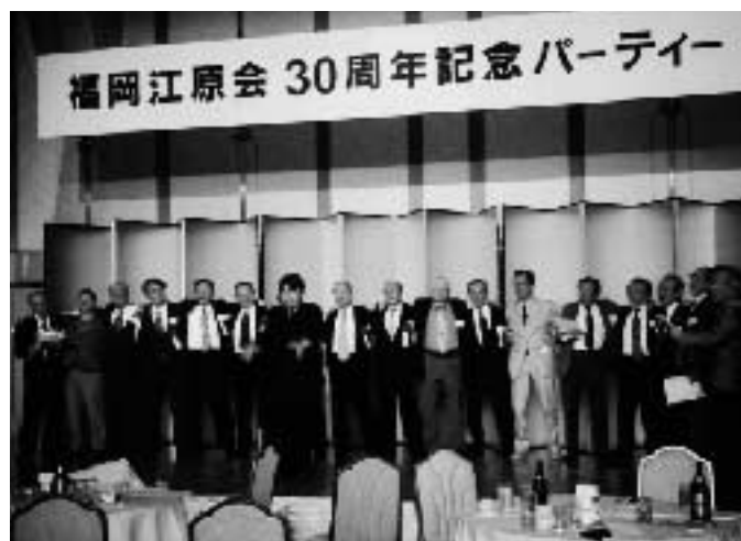
福岡江原会 30周年記念パーティー

昭和五五年三月に熊高を卒業して後の二三年間、私は同窓の集いに全く無関心でありました。暗黒の高校時代を過したからです。